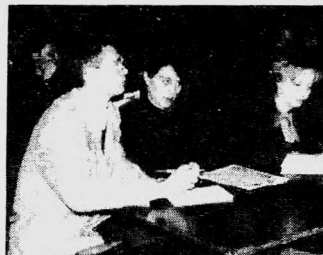
Встреча со студентами, стр. 1.