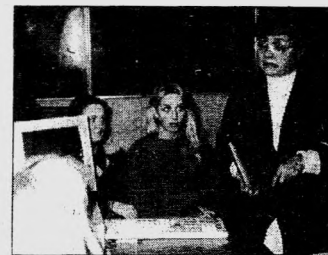
ИИСС - 5 лет! стр. 8-15.