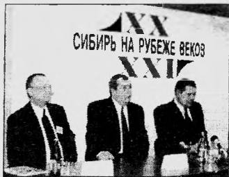
Достижения конференции, стр. 1-2-3.